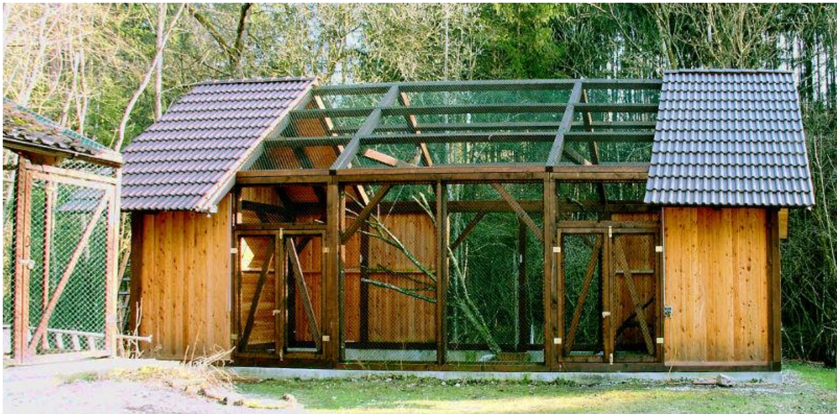
Ggf.- Bildrecht beachten

Jede/r, der einen Greifvogel oder einen Eulenvogel erwerben und halten möchte, sollte sich zuallererst seiner Motive dazu klar werden und das Tierwohl muss an allererster Stelle stehen.