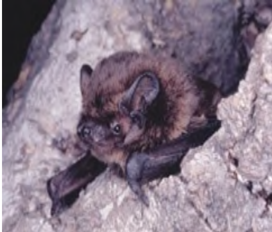
Kleiner Abendsegler