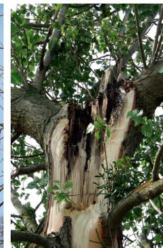
Bruch nach Kappung