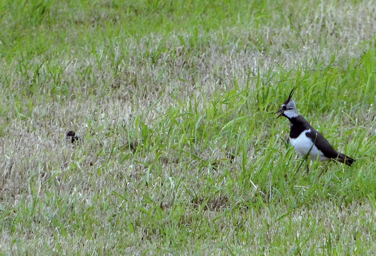
Warnender Kiebitz mit Küken.